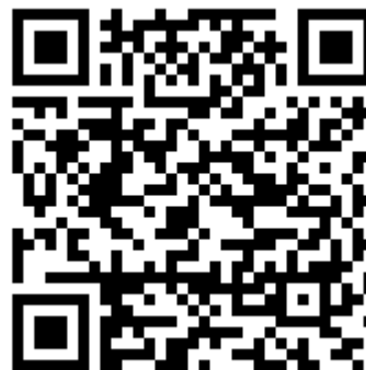
Scorekeeper til Android